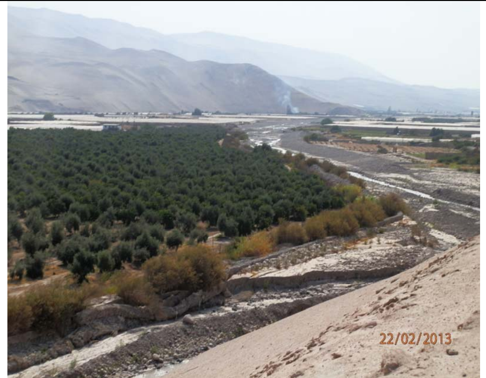
Sector Alto Valle de Azapa

La Caracterización de la Cuenca del río San José, permitirá identificar posibles sectores de infiltración en el valle de Azapa.